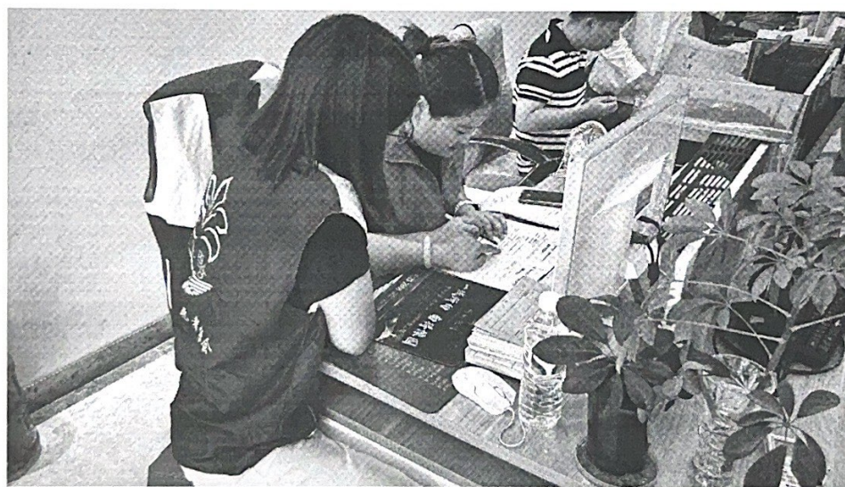
(在洪泽水上百合查看整改材料)