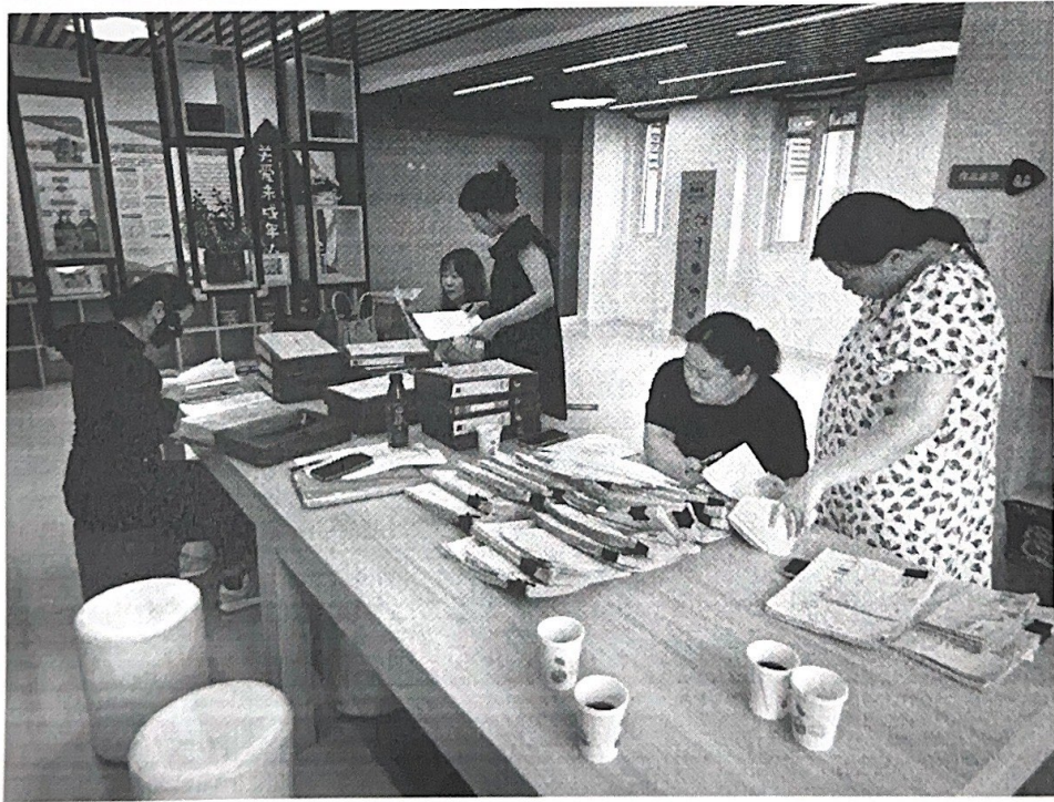
(在南京雅书阁查看整改材料)